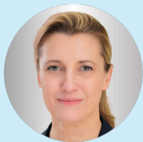
Sandra Postel Präsidentin der Pflegekammer NRW